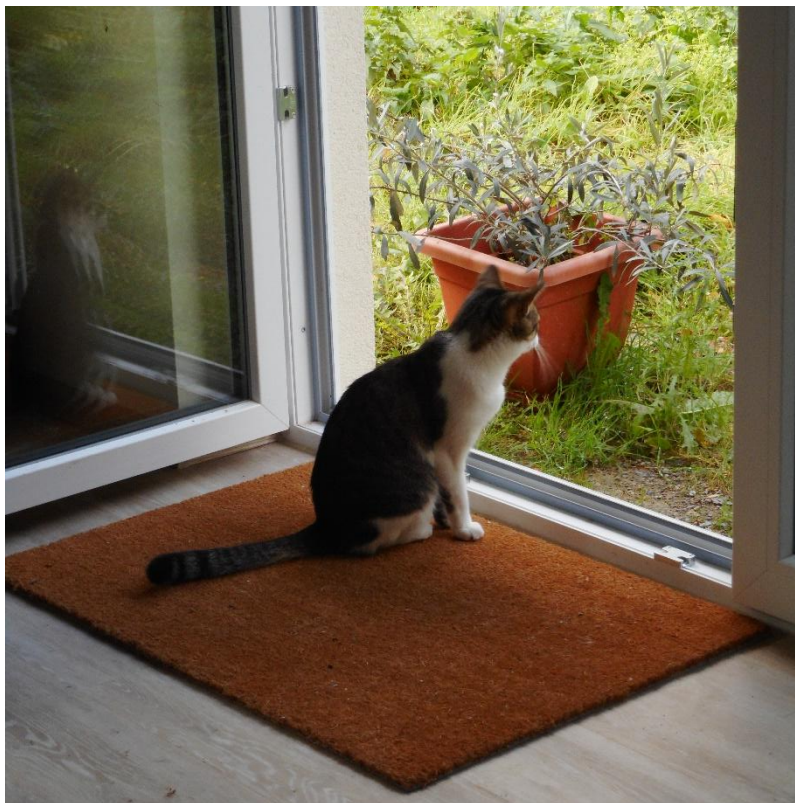
Der optimale Ausgang zum Garten