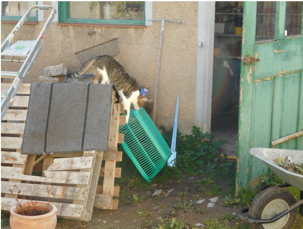
Im Hof gibt immer etwas zu entdecken