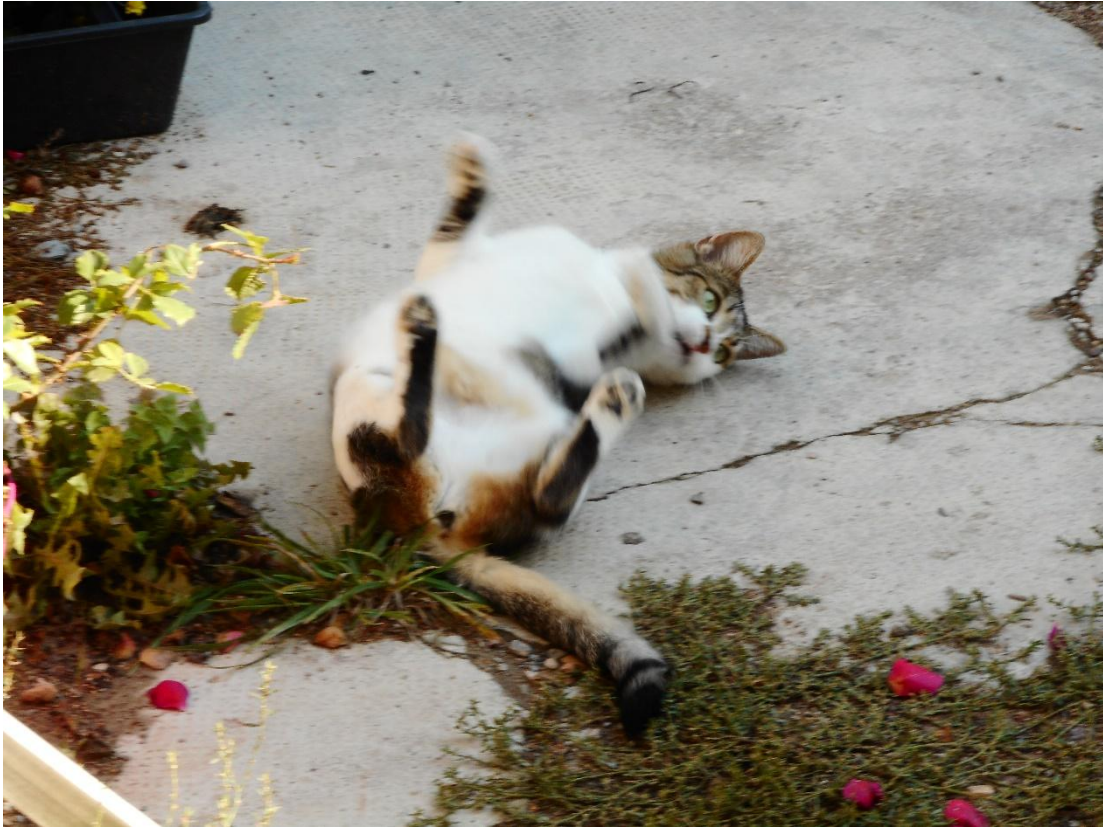
Oder Laura aalt sich in der Sonne