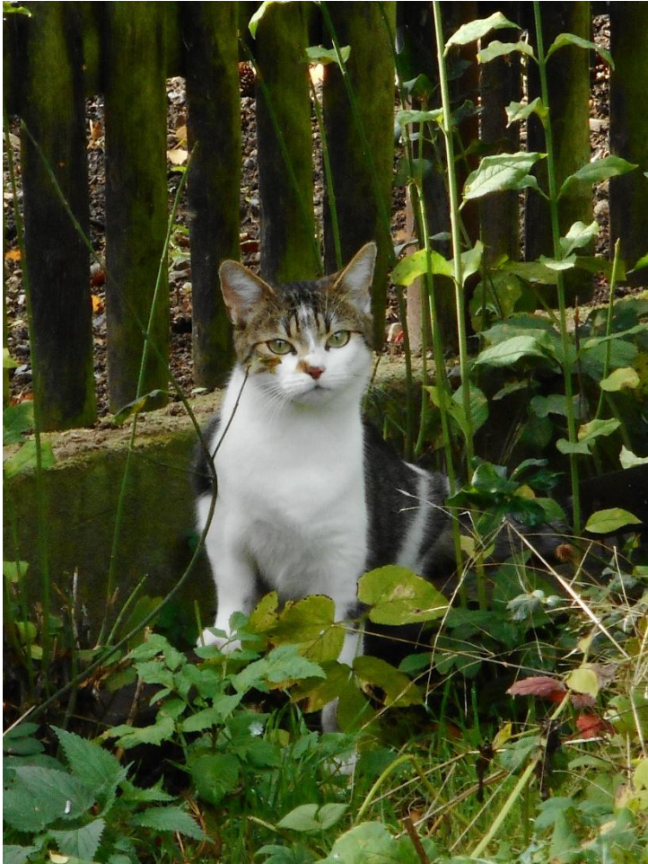
So schön ist es im Grünen